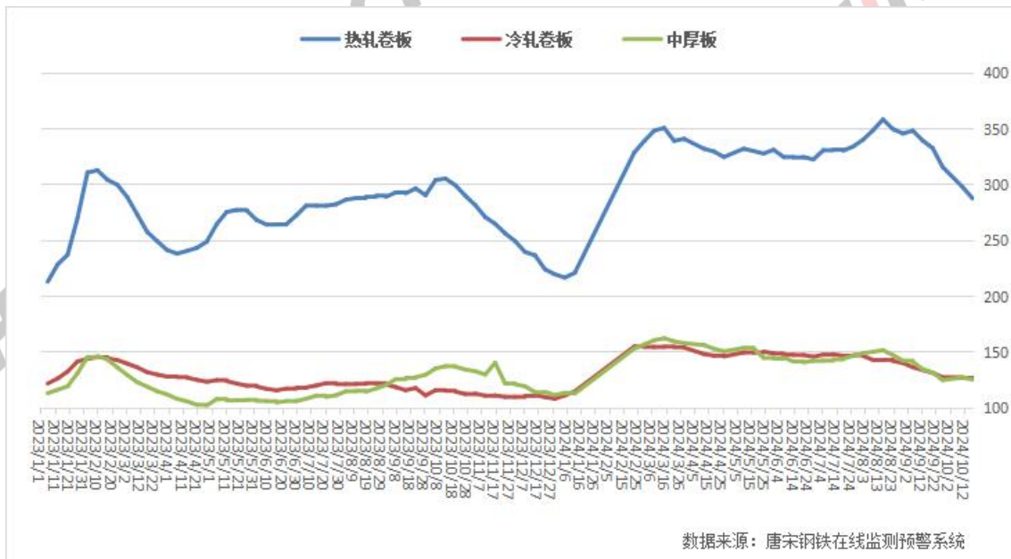
图五: 全国热卷、中板、冷轧社会库存走势图

本周热卷、中板、冷轧社库均下降。其中热卷社库 287.9 万吨, 较上周降 10.23 万吨; 冷轧社库 126.16 万吨, 较上周降 0.71 万吨; 中板社库 125.29 万吨, 较上周降 1.94 万吨。