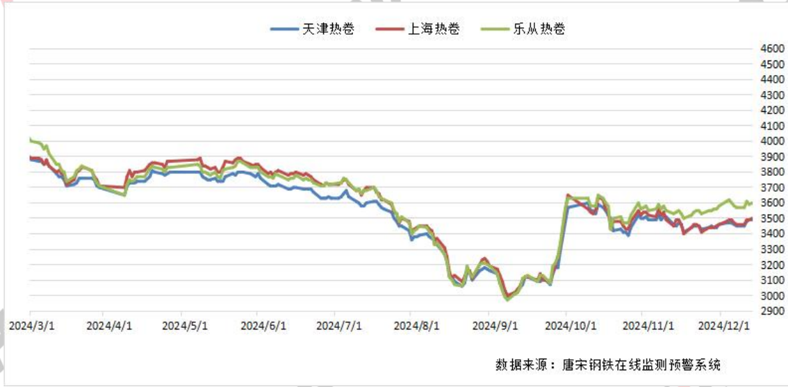
图一：全国重点区域热卷价格走势图