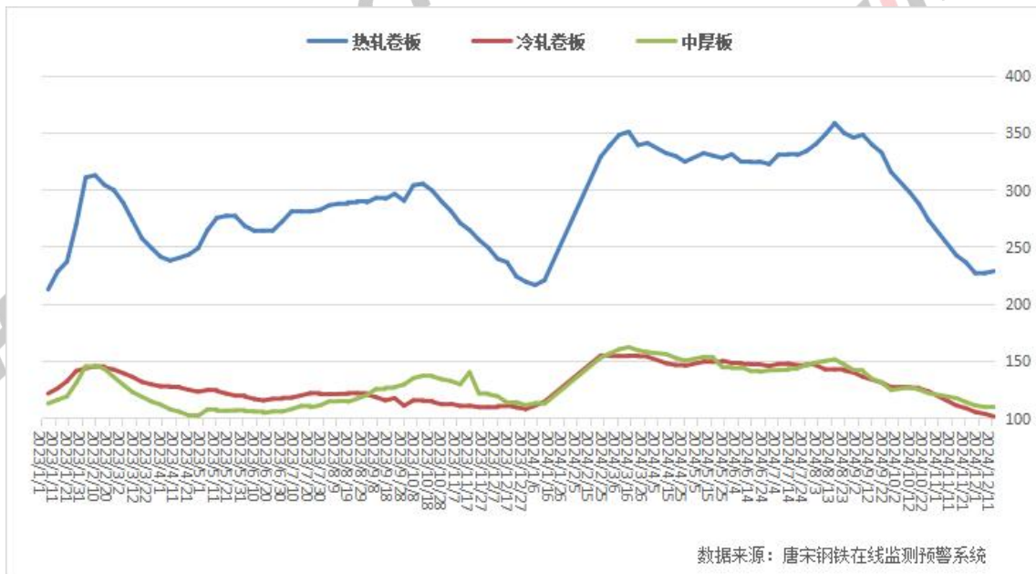
图五: 全国热卷、中板、冷卷社会库存走势图

本周热卷、中板社库小幅上升, 冷卷社库继续下降。其中热卷社库 229.01 万吨, 较上周增 1.72 万吨; 冷卷社库 101.72 万吨, 较上周降 2.34 万吨; 中板社库 111 万吨, 较上周增 0.94 万吨。