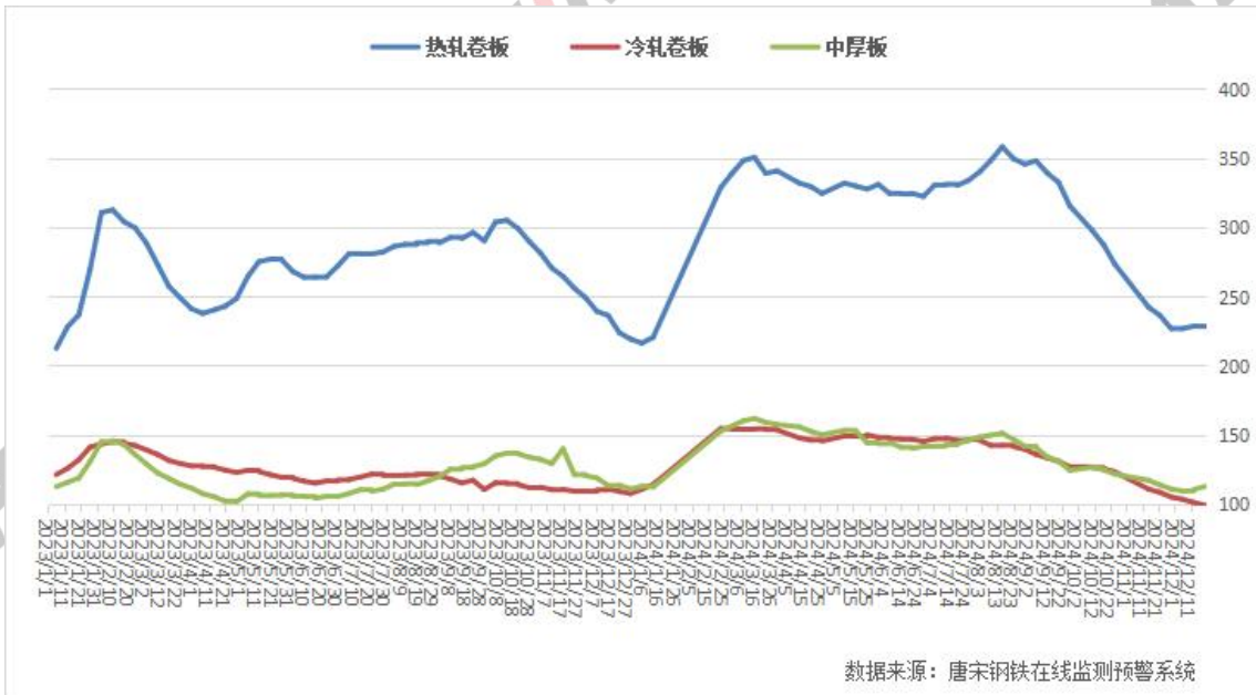
图五: 全国热卷、中板、冷卷社会库存走势图

本周热卷、中板社库继续小幅上升, 冷卷社库继续下降。其中热卷社库 229.65 万吨, 较上周增 0.64 万吨; 冷卷社库 99.68 万吨, 较上周降 2.04 万吨; 中板社库 113.34 万吨, 较上周增 2.34 万吨。