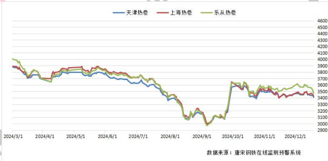
图一：全国重点区域热卷价格走势