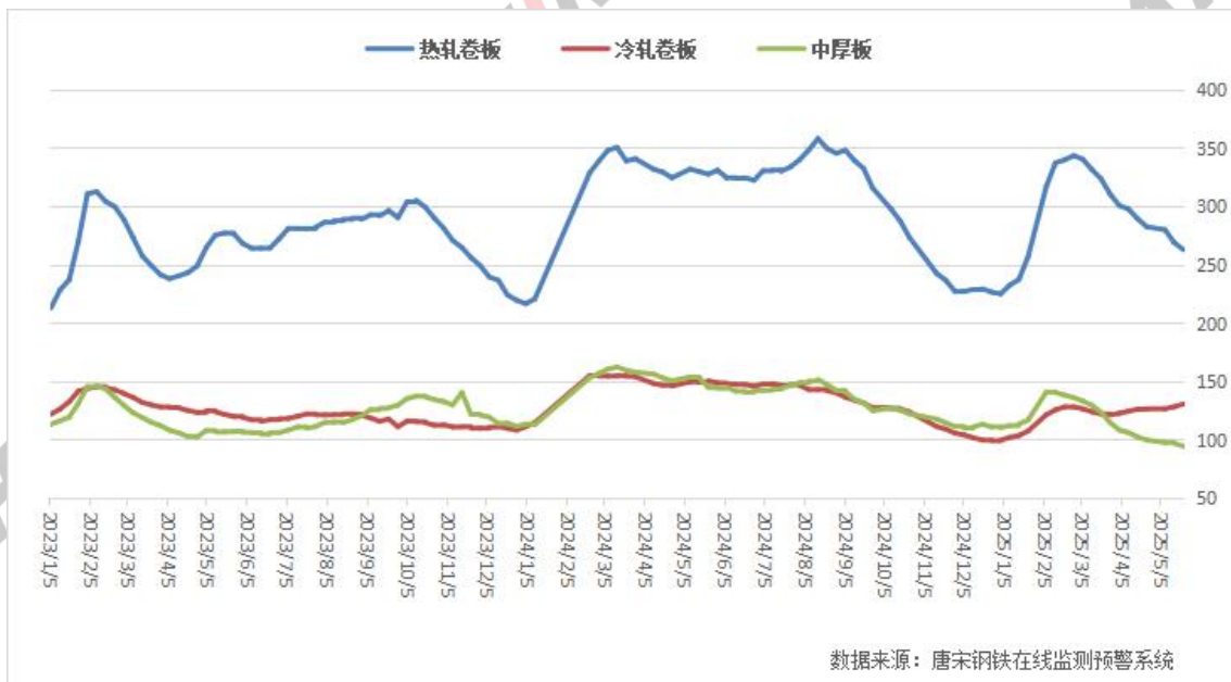
图五: 全国热卷、中板、冷轧社会库存走势图

本周热卷、中板社库下降, 冷轧社库上升。其中热卷社库 263.27 万吨, 较上周减 6.08 万吨; 冷轧社库 130.58 万吨, 较上周增 2.35 万吨; 中板社库 94.41 万吨, 较上周减 2.48 万吨。