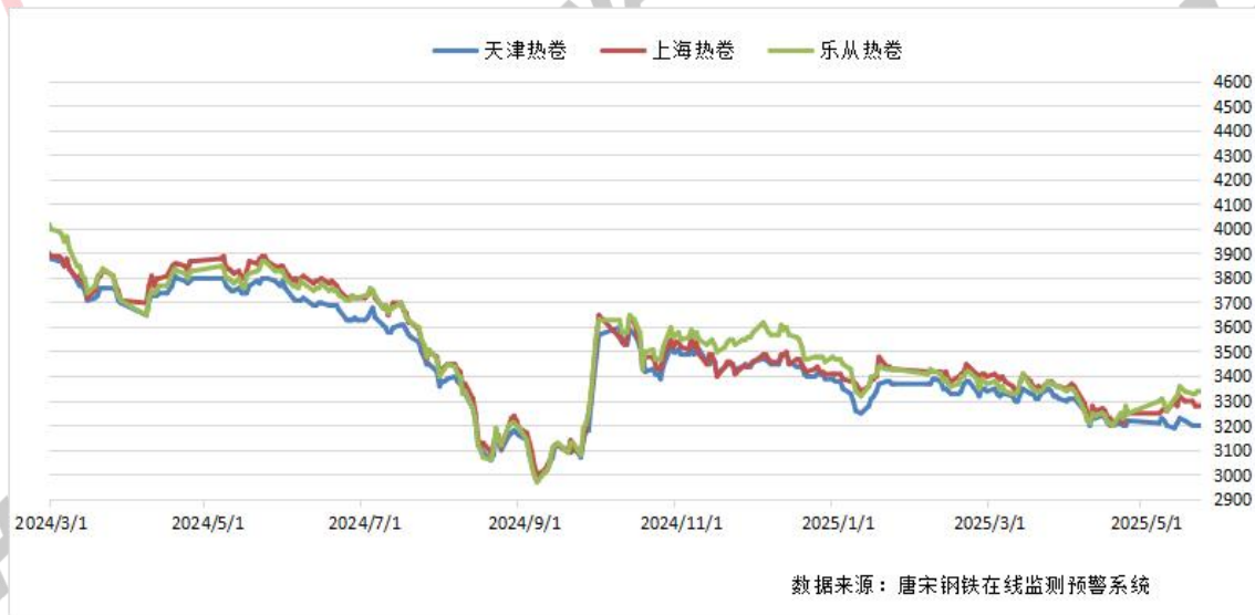
图一：全国重点区域热卷价格走势图