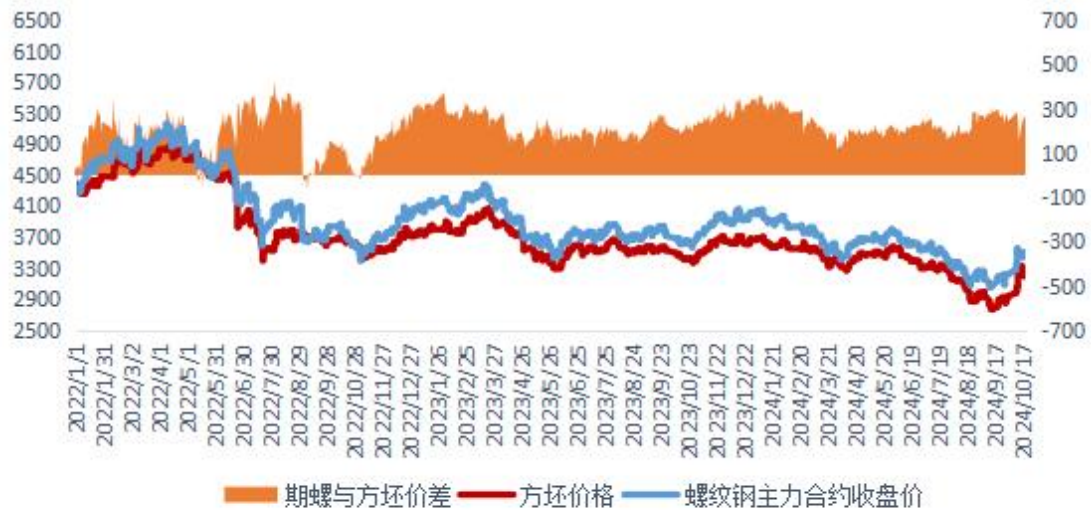
螺纹01合约与钢坯价差 (主力3336-钢坯3080=256)