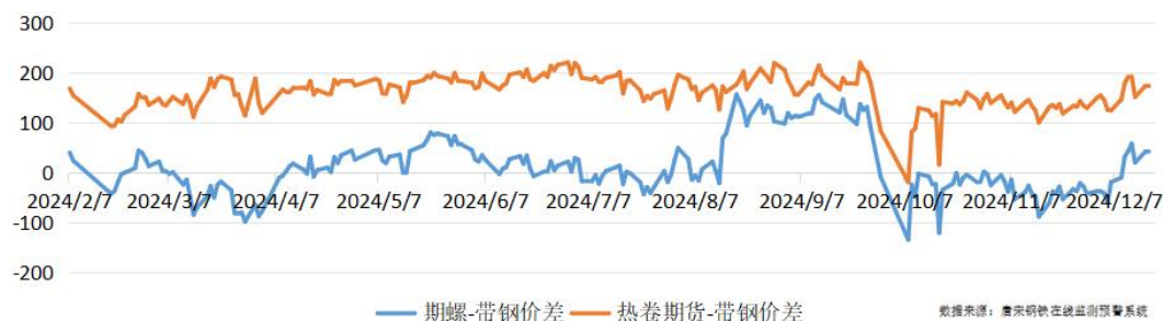
螺纹、热卷主力合约与带钢价差 (螺纹主力3364-带钢3320=44) (热卷主力3493-带钢3320=173)