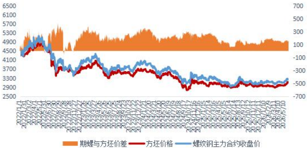
螺纹10合约与钢坯价差 (主力3180-钢坯3040=140)