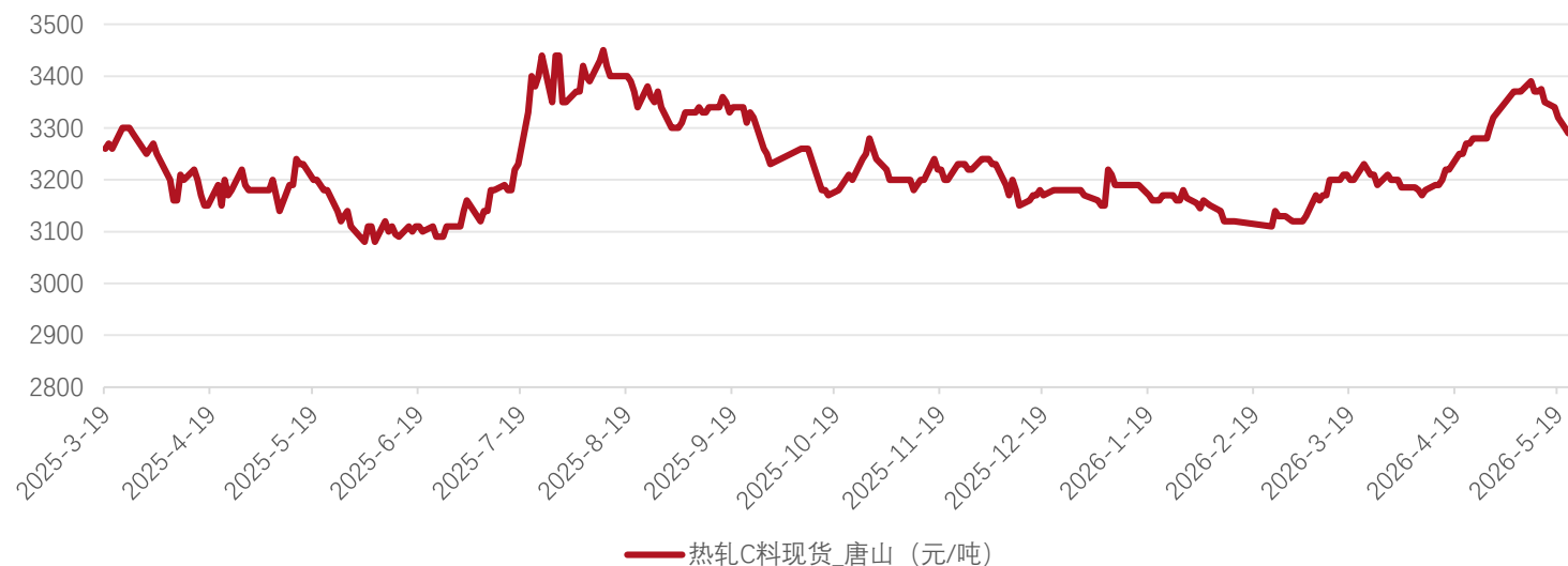
热轧C料现货_唐山 (元/吨)