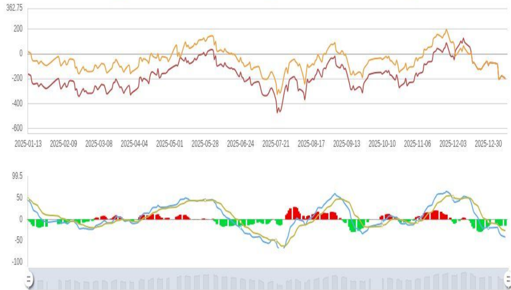
焦炭主力合约基差_前复权 (元/吨) 焦炭主力合约基差_前复权 (元/吨)_macd 焦炭主力合约基差_前复权 (元/吨)_dif 焦炭主力合约基差_前复权 (元/吨)_dea