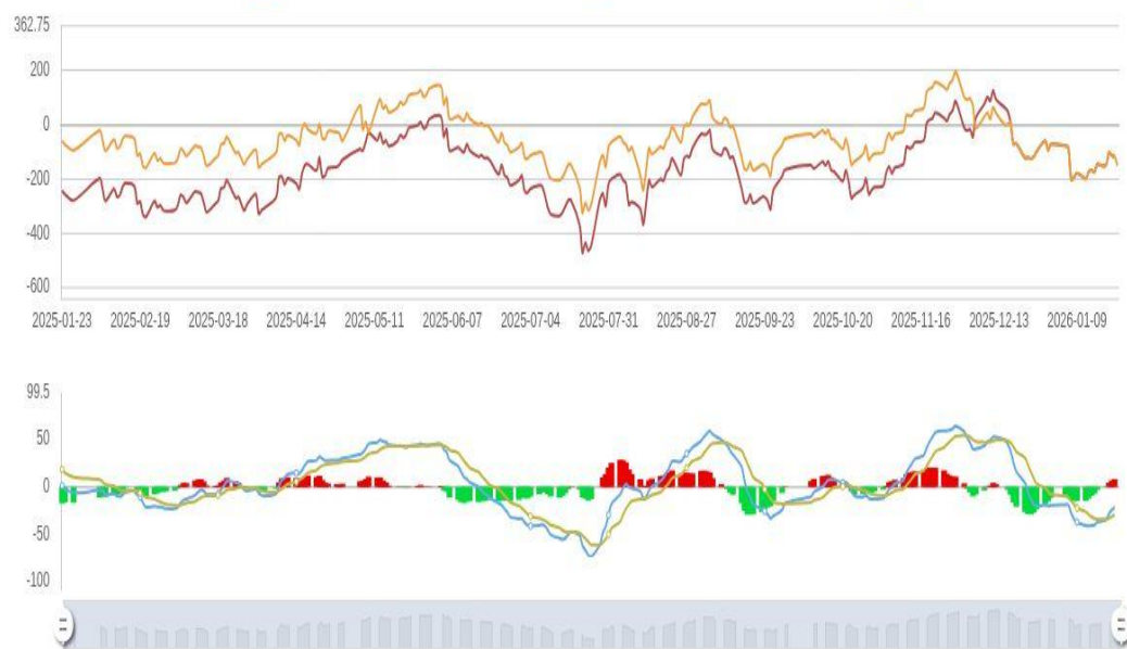
焦炭主力合约基差_前复权 (元/吨) 焦炭主力合约基差_前复权 (元/吨)_macd 焦炭主力合约基差_前复权 (元/吨)_dif 焦炭主力合约基差_前复权 1/2