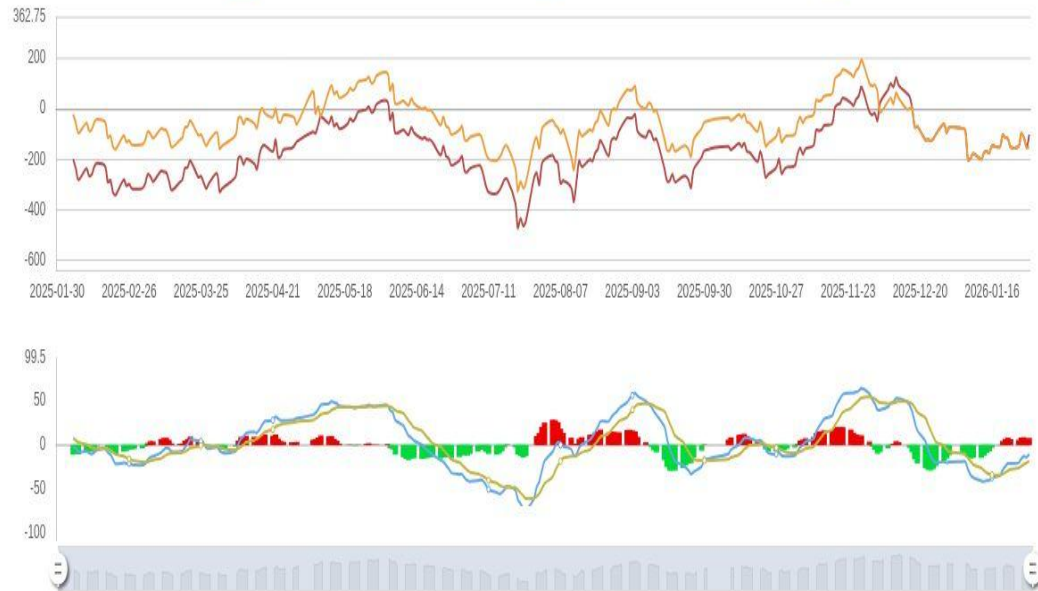
焦炭主力合约基差_前复权 (元/吨) 焦炭主力合约基差_前复权 (元/吨)_macd 焦炭主力合约基差_前复权 (元/吨)_dif 焦炭主力合约基差_前复权 1/2