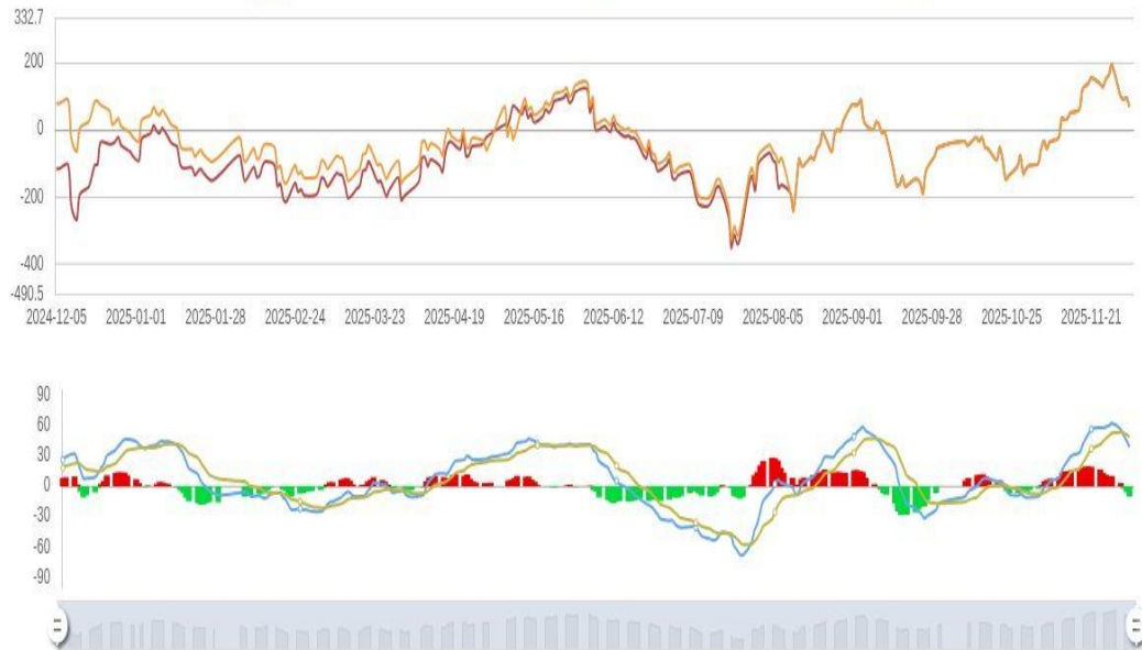
焦炭主力合约基差_前复权 (元/吨) 焦炭主力合约基差_前复权 (元/吨)_macd 焦炭主力合约基差_前复权 (元/吨)_dif 焦炭主力合约基差_前复权 1/2